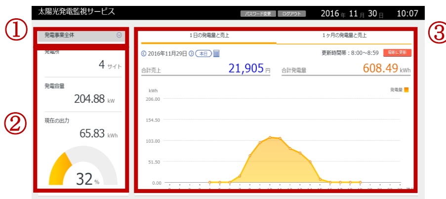
図：スマートデバイス用ポータルのトップ画面